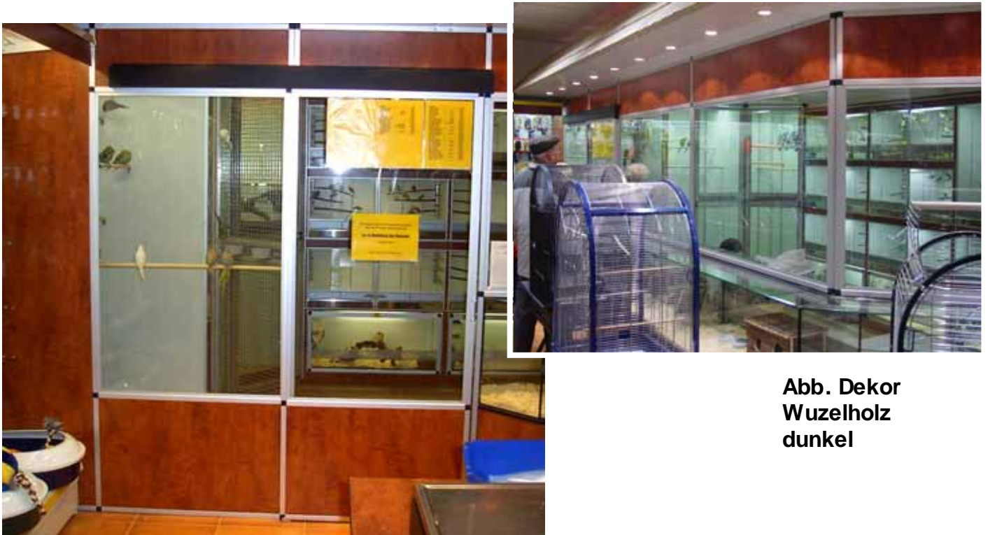
Abb. Dekor Wuzelholz dunkel