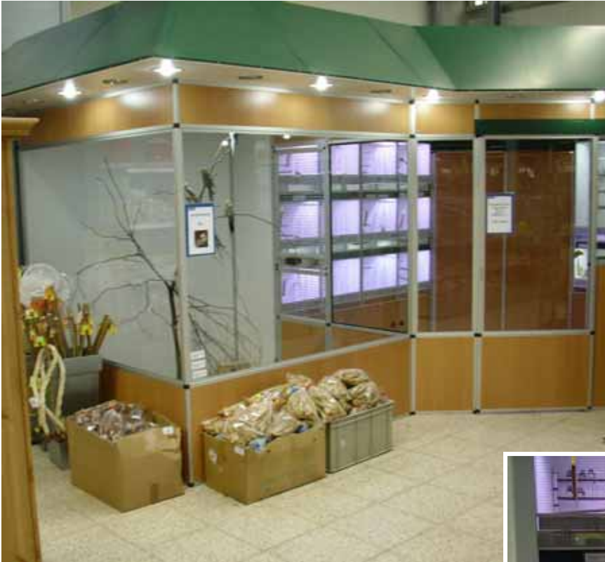
Abb. Dekor Buche